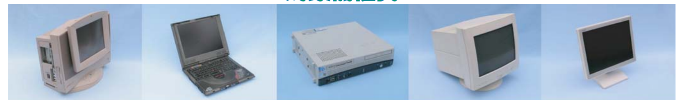
ディスプレイ体型パソコン ノートパソコン デスクトップパソコン本体 CRTディスプレイ 液晶ディスプレイ

◆キーボードやマウス、プリンターなどの周辺機器は、 燃やさないごみ となります。