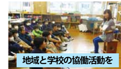
地域と学校の協働活動を